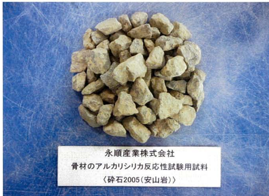
試験用試料の搬入写真