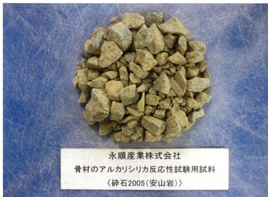
試験用試料の搬入写真